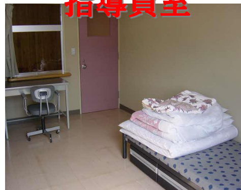
宿泊室 6室 × 8名 (最大 48名)