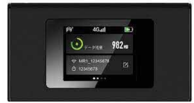
モバイルルーター